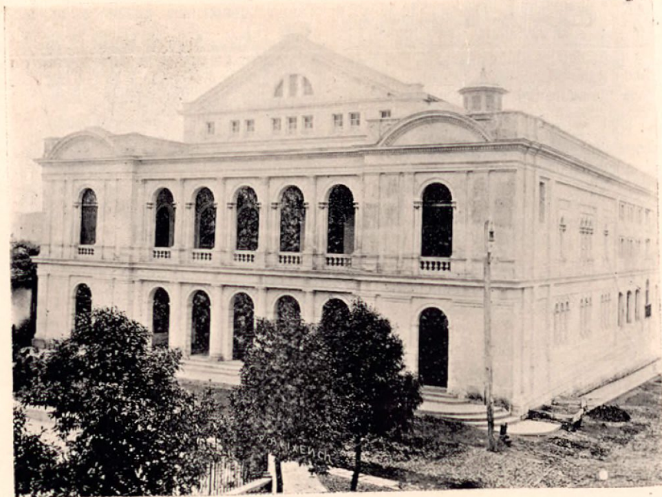
Teatro de la ciudad de Santa Ana, en El Salvador

El simbolismo de este telón, es el triunfo de las bellas artes; las figuras, correctamente delineadas, de